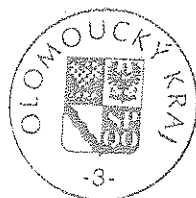
Ing. Zdeněk Švec náměstek hejtmána Olomouckého kraje